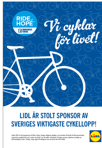
Exempel på annons